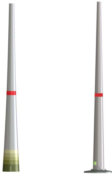
Abb. 5: Farbliche Kennzeichnung am Hybridturm (links) und am MST (rechts)

Zur farblichen Kennzeichnung wird ein 3 m hoher Farbstreifen in Verkehrsrot (RAL 3020) in 40 m \pm 5 m Höhe am Turm angebracht.