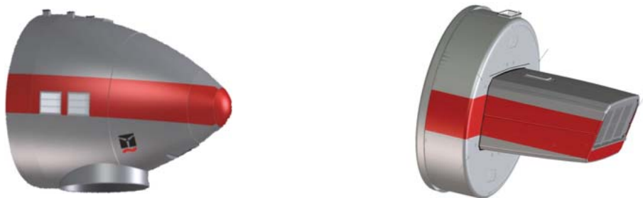
Abb. 4: Farbliche Kennzeichnung an der Gondel, Tropfenform (links) und Kompaktform (rechts)

Zur farblichen Kennzeichnung wird ein 2 m hoher, umlaufender Farbstreifen in Verkehrsrot (RAL 3020) an der Gondel angebracht.