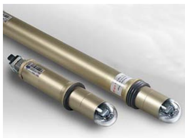
Abb. 2: Befuerungsleuchte Turm

Durch behördliche Vorschriften kann eine Befuerung des Turms gefordert werden. Dazu wird der Turm mit einer, seltener mit zwei Befuerungsebenen mit jeweils 4 Stableuchten ausgerüstet. Eine Nachrüstung von Leuchten am Turm ist nur mit sehr hohem Aufwand möglich.