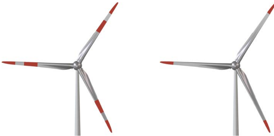
Abb. 3: Farbliche Kennzeichnung am Rotorblatt

Zur farblichen Kennzeichnung werden 6 m breite Streifen im Farbton Verkehrsrot (RAL 3020) an den Rotorblättern angebracht.