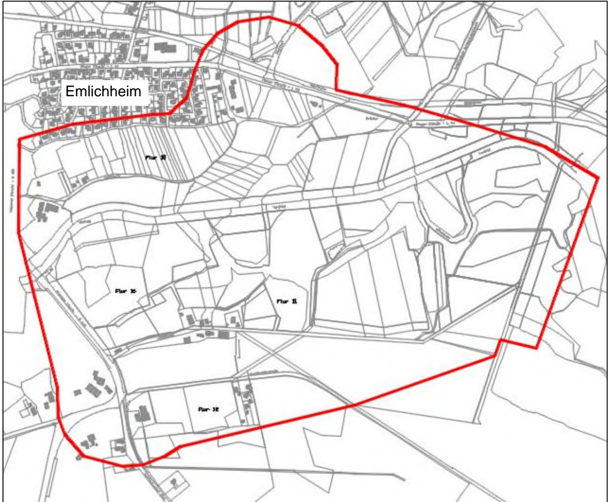
Abbildung 1: Abgrenzung des Untersuchungsgebietes

Erdgasspeicher Kalle GmbH, der in einer Entfernung zum Vorhaben von mehr als 2500 m liegt.