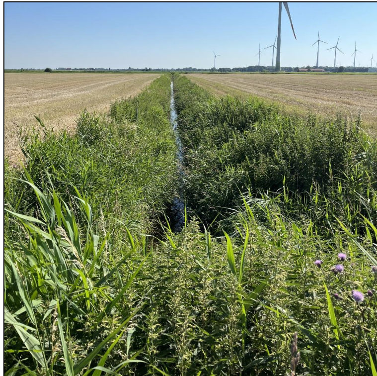
Abb. 5: Ulkaampschloot (Biototyp FGR) zwischen Fläche B, Blick vom Weg ‚Am Fehntjer Tief‘ Richtung Osten