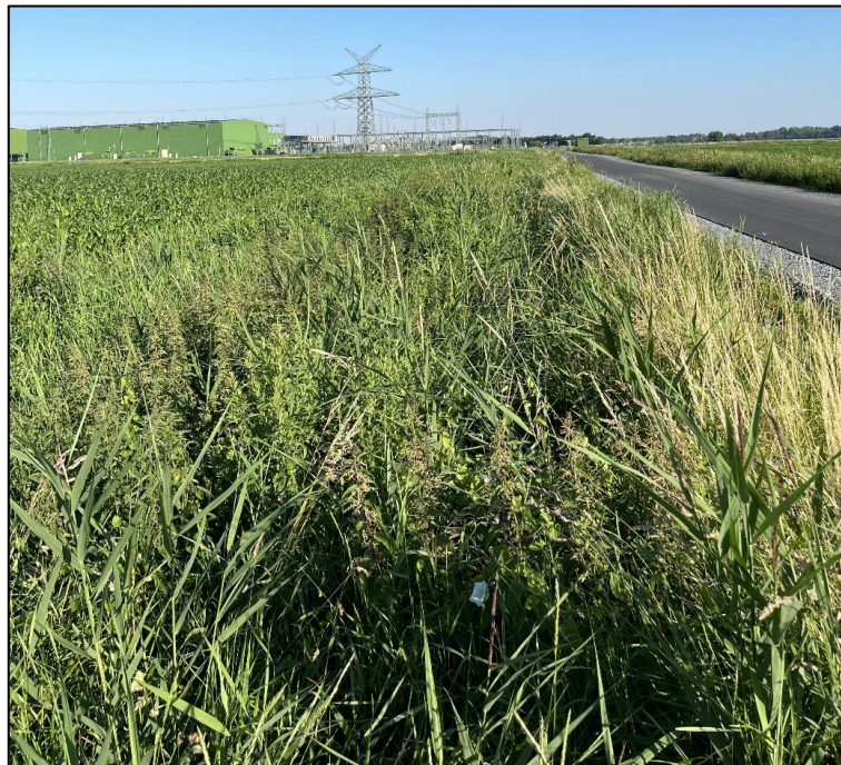
Abb. 7: Wegrandgraben (FGR) am Weg ‚Am Fehntjer Tief‘, Blick Richtung Westen