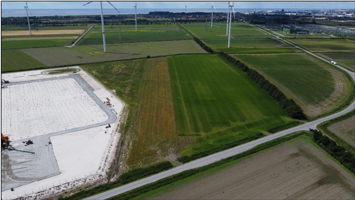
Abb. 2: Blick Richtung Süden auf Baufläche A (Biotoptyp AT) und südlich gelegener Baufläche C mit westlich (rechts) verlaufendem Gehölzstreifen (HPS) und östlich (links) gelegener Baustelle des HGÜ-Konverters