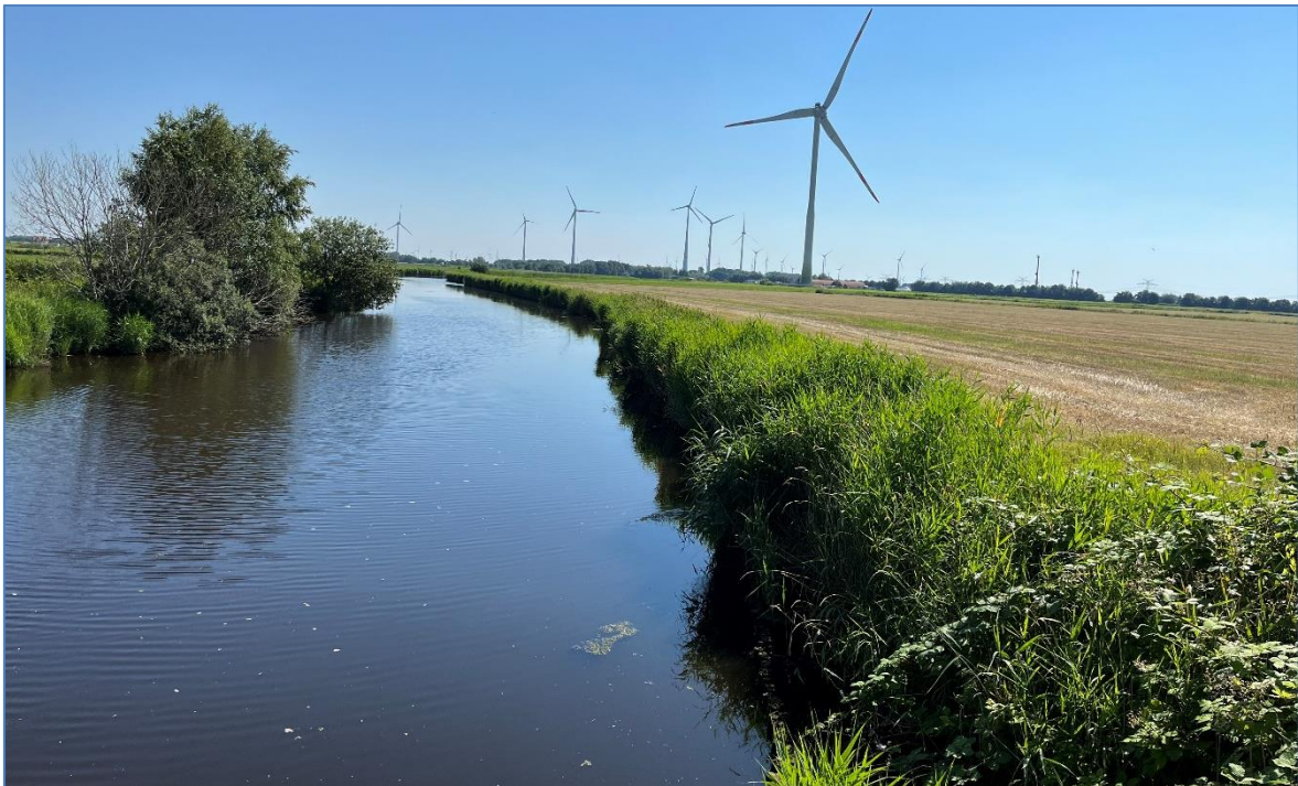
Abb. 8: Blick auf das Fehntjer Tief von der Brücke Richtung Osten. Südlich (rechts) liegt das Flurstück, auf welchem sich Baufläche B befindet (H & M 26.06.2024).

Das Fehntjer Tief wurde zum Zwecke der Entwässerung sowie für die Erschließung von Mooregebieten für die Schifffahrt ausgebaut. Es ist im Emdener Stadtgebiet stark begradigt und fast durchgängig mit Spundwänden an den Ufern befestigt. Der Abschnitt von Petkum bis Herrentor wurde künstlich gegraben und hieß ursprünglich Sägemüller Tief (LRP Emden 2019: 221). Im Rahmen der Biotoperfassung erfolgt eine Klassifizierung als „Mäßig ausgebauter Marschfluss ohne Tideeinfluss“ (FVM). Die Wasserfläche hat hier eine Breite von ca. 17 bis 20 m und wird gesäumt von einem Schilfröhricht. Eine Uferbefestigung aus Holzpfehlern ist hier vorhanden. Diese verläuft infolge von Uferabbrüchen teils etwas vor der Uferkante.