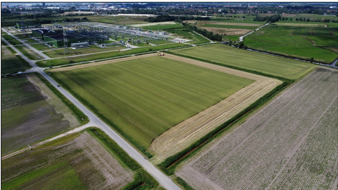
Abb. 3: Blick Richtung Westen auf Baufläche B (Biotoptyp AT) mit nördlich verlaufendem Fehntjer Tief (FVM) und südwestlich gelegenem Umspannwerk Emden-Ost (Biotoptyp OKV) 1