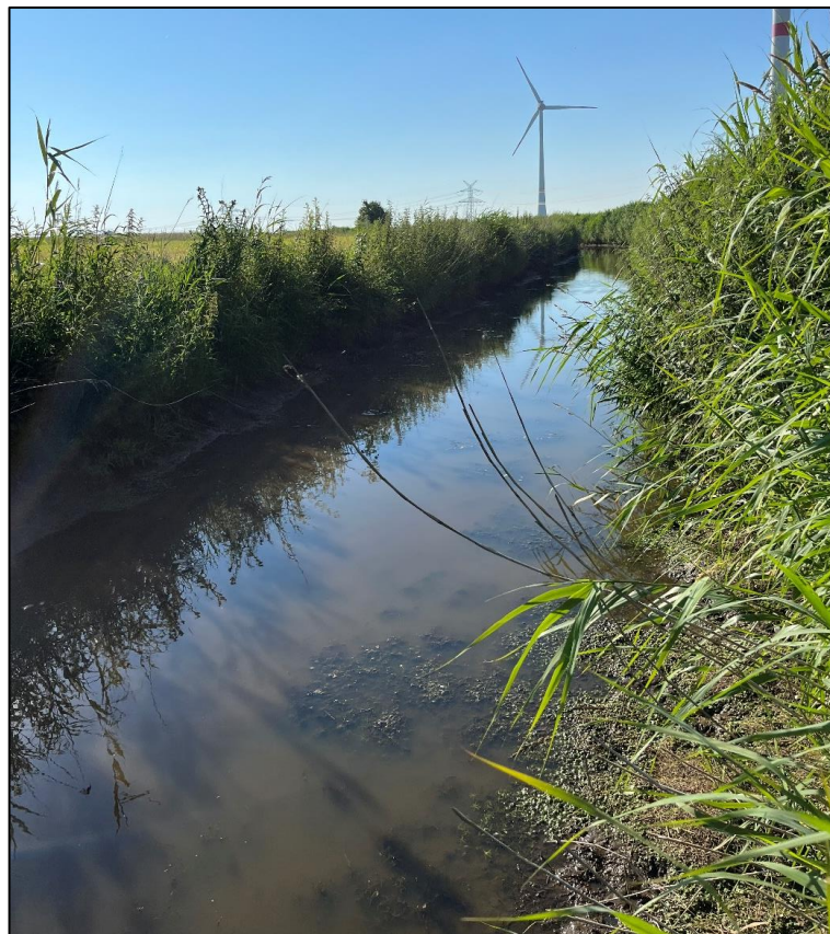
Abb. 4: Ulkampschloot (Biotoptyp FGR) Blick Richtung Osten, zwischen Fläche A und C

Das Grabennetz wurde nach der Überschlickung neu ausgebaut. Die Gräben sind aktuell dem Biotoptyp „Nährstoffreicher Graben“ (FGR) zuzuordnen. Die Gräben werden von halbruderalen Gras- und Staudenfluren gesäumt, teils finden sich Schilfröhrichte, die in untergeordnete Gräben auch hineinwachsen. Hauptvorfluter im Gebiet ist der Ulkampschloot, welcher von West nach Ost durch das Gebiet verläuft und im Osten eine Breite von mehr als 5 m erreicht. Er beginnt beim Gelände des Umspannwerk Emden-Ost, quert Planfläche B und fließt auch zwischen Planfläche A und C hindurch.