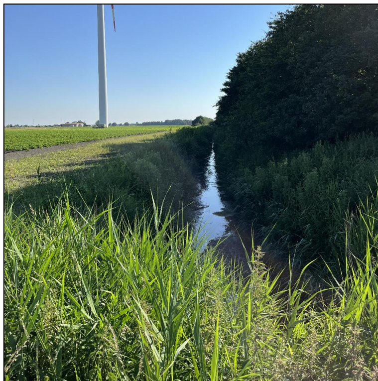
Abb. 6: Graben (FGR) und Gehölzstreifen (HPS) westlich von Fläche C, Blick vom Weg ‚Am Fehntjer Tief‘ Richtung Nordosten