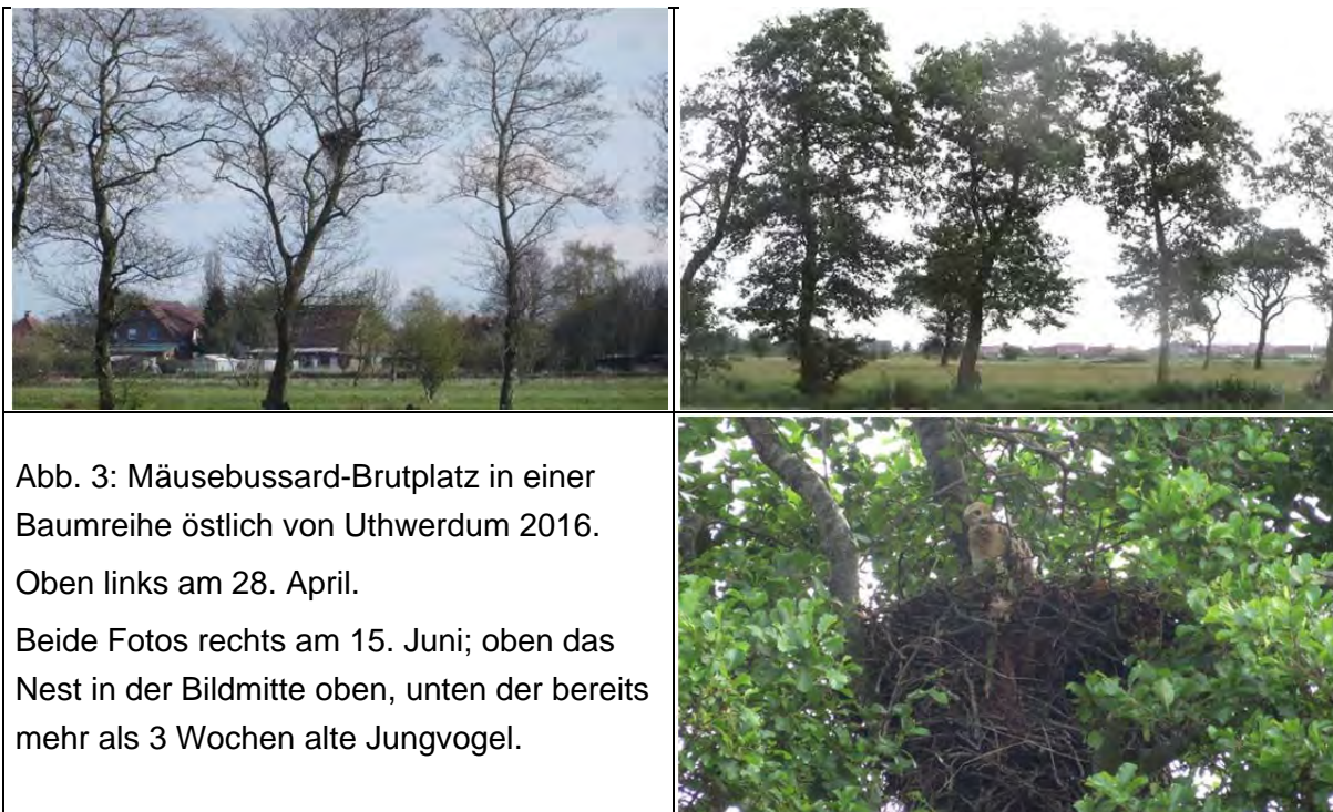
Abb. 3: Mäusebussard-Brutplatz in einer Baumreihe östlich von Uthwerdum 2016. Oben links am 28. April. Beide Fotos rechts am 15. Juni; oben das Nest in der Bildmitte oben, unten der bereits mehr als 3 Wochen alte Jungvogel.