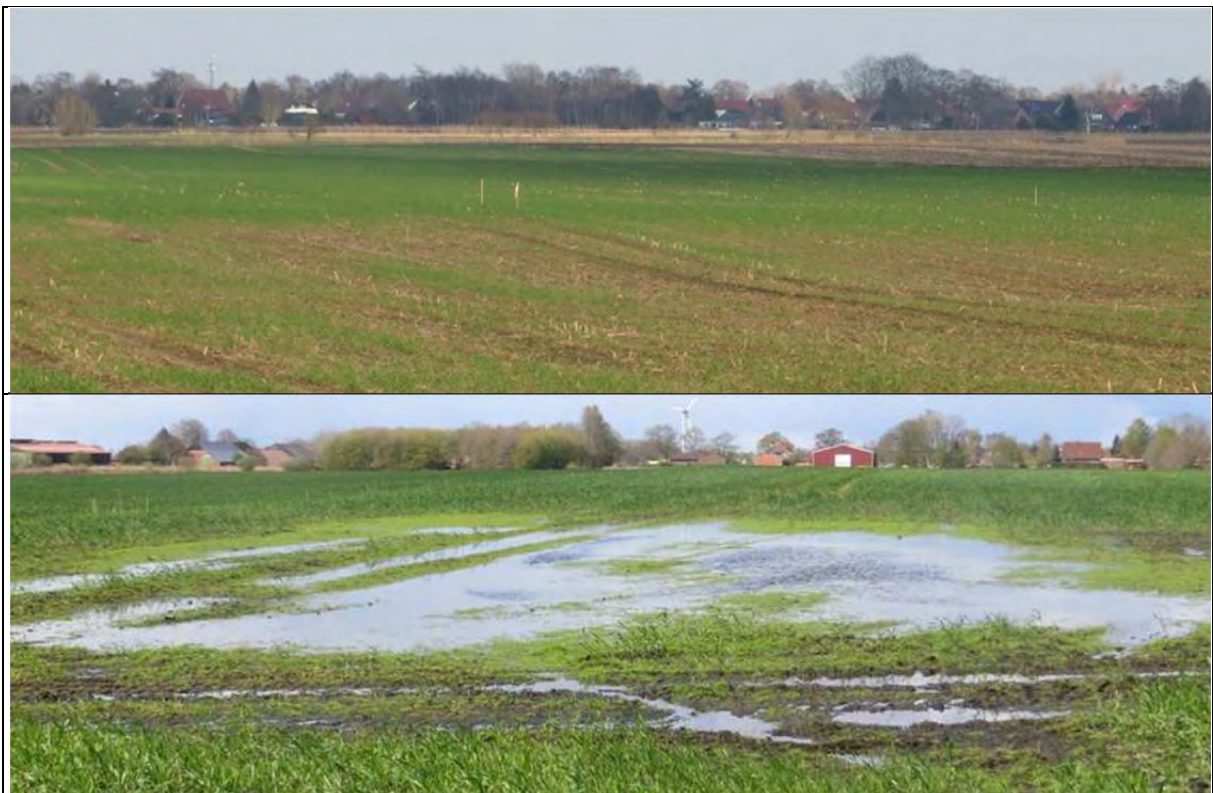
Abb. 4: Kiebitz-Lebensraum auf einem großen Getreidefeld nördlich des Uthwerdumer Vorfluters mit Kolonie-Vorkommen. Oben am 03.04.2016 (Blickrichtung Ost; 2 Kiebitz-Gelege sind markiert). Unten am 28.04.2016 (Blickrichtung West). Insbesondere Störstellen mit wassergefüllten Regenblänken waren zur frühen Brutzeit attraktiv.

Südöstlich von Uthwerdum bestanden allein 11 Reviere (Kolonie) auf Getreidefeldern beidseitig des gleichnamigen Vorfluters, welche mehrere Störstellen mit Regenblänken aufwiesen (Abb. 4). Diese waren bereits zur frühen Brutzeit besetzt, jedoch schlecht einsehbar. Bei Aufflügen in Folge verschiedener Ursachen fielen dort 18 Individuen am 3. April auf, 25 Individuen am 13. April, 15 Individuen am 7. Mai und noch 15 Individuen am 18. Mai. Bei Anwendung des Multiplikationsfaktors von 0,7 für Individuenmaxima in schwer einsehbaren