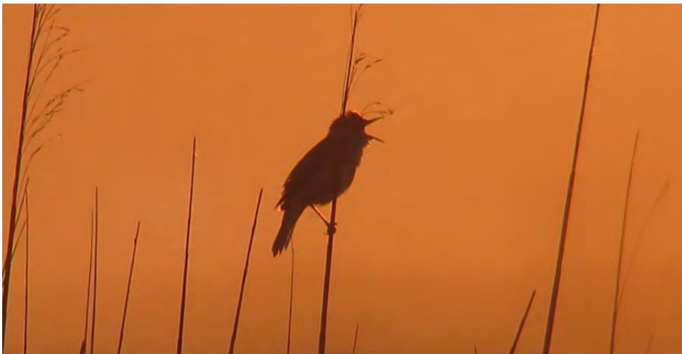
Sumpfrohrsänger an der B 72 am 05.06.2016 (5:24 Uhr)