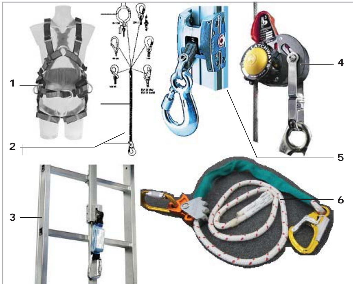
Abb. 2: Beispiele für Teile der persönlichen Fallschutzausrüstung