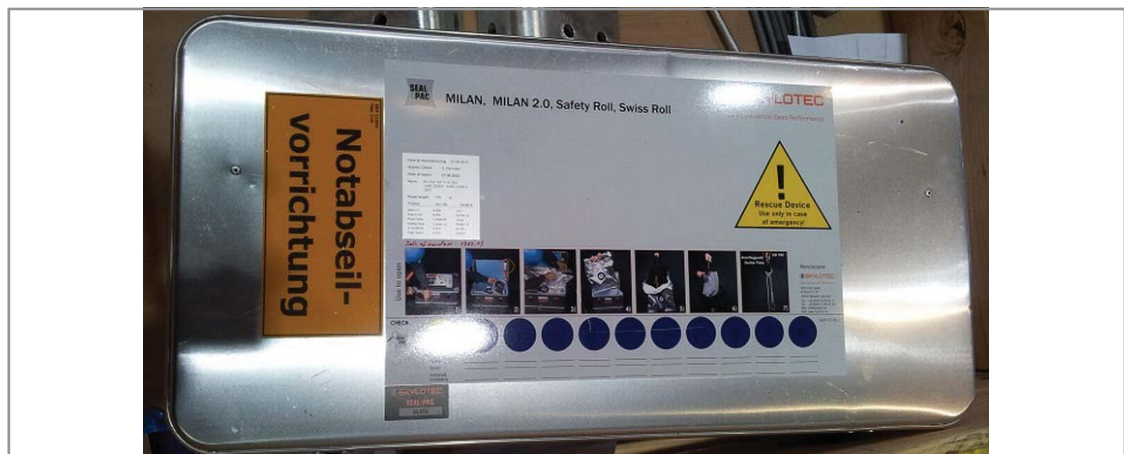
Abb. 3: Notabseilausrüstung in der WEA