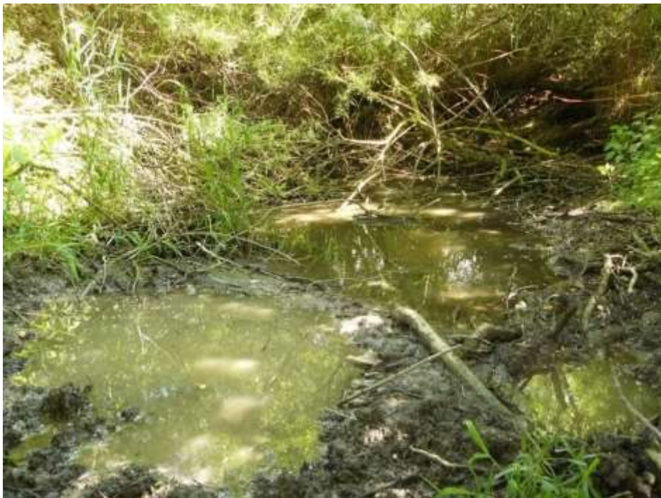
Abbildung 14: Amphibien - Gewässer A6 (eigene Aufnahme vom 21.06.2021).

Das Gewässer A6 liegt nördlich von Üfingen (Stadt Salzgitter) am Südrand eines kleinen Waldgebietes. Im Nordwesten verläuft eine Bahntrasse, im Osten befindet sich die Aue. Die weitere Umgebung ist neben Grünlandflächen und Ruderalfluren entlang der Aue auch von großflächigen Äckern geprägt. Im Nordosten befinden sich mehrere Klärteiche und Abgrabungsgewässer sowie der Stichkanal Salzgitter. Das flache Kleinstgewässer ist vollständig mit Weidengebüsch umstanden und es findet Totholzeintrag ins Gewässer statt. Das stark verschlammte Gewässer weist eine bräunliche Trübung auf. Außerdem wird das Gewässer vollständig beschattet, Gewässervegetation aus Schilf und Sumpf-Wasserstern ( Callitriche palustris agg.) ist nur kleinräumig vorhanden (Abbildung 14). Im Frühling war der Kleinweiher stark veralgt, ab Mitte Juni konnten jedoch keine Algen mehr festgestellt werden. An den schlammigen Ufern wachsen Gewöhnliche Hasel ( Corylus avellana ), Korb-Weide ( Salix viminalis ), Schwarzer Holunder ( Sambucus nigra ) und Große Brennnessel.