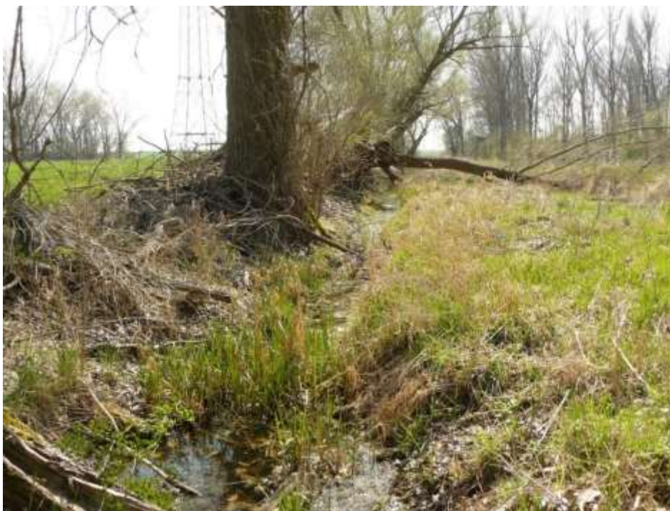
Abbildung 12: Amphibien - Gewässer A5 (eigene Aufnahme vom 20.04.2021).

Das Gewässer A5 befindet sich östlich der beiden Untersuchungsgewässer A3 und A4. Es handelt sich um einen Entwässerungsgraben, der am Ostufer von einer Baumreihe gesäumt wird (Abbildung 12). Der stehende Graben ist ca. 0,5 m breit, flach und weist eine leicht bräunliche Trübung auf. Durch die angrenzenden Gehölze wird der Graben halb beschattet und es findet ein hoher Laubeintrag statt. Der vegetationsreiche Graben ist z. T. mit flutenden Süßgräsern bewachsen. Die Ufergehölze werden von Weiden und Kanadischer Pappel dominiert. Das Gewässer war zum Zeitpunkt der Kartierungen leicht veralgt, nach Süden nimmt die Veralgung deutlich zu, was auf Nährstoffeinträge von den umliegenden Ackerflächen hindeutet. Im Gewässer befinden sich zahlreiche Insektenlarven und Wasserasseln. Bis zum Sommer trocknete der Graben mit Ausnahme einiger Senken fast vollständig aus.