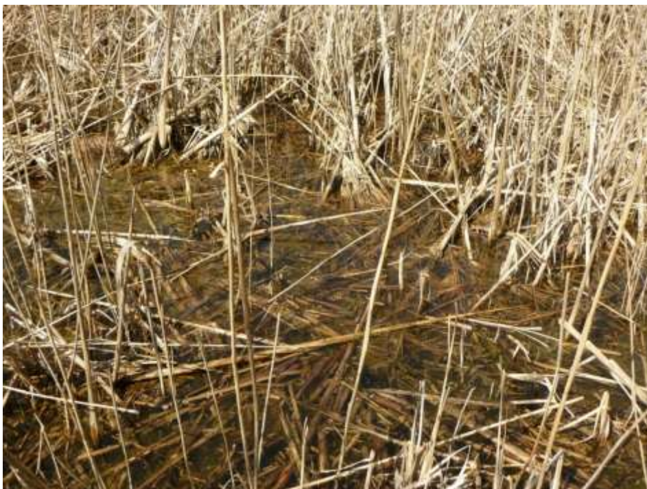
Abbildung 9: Amphibien - Gewässer 08 (eigene Aufnahme vom 20.04.2021).

Das Untersuchungsgewässer A8 befindet sich östlich von Gewässer A7 ebenfalls innerhalb des Kalkbruchs. Der flache, stark verlandete Kleinweiher weist eine leicht bräunliche Trübung auf und wird von den umliegenden Gehölzen gering beschattet. Der Gewässergrund ist sehr schlammig und weist einen fauligen Geruch auf, außerdem war das Gewässer zum Zeitpunkt der Kartierung leicht veralgt sowie stellenweise vermüllt. Der Kleinweiher ist vollständig mit Schilf und Breitblättrigem Rohrkolben bestanden, stellenweise wachsen auch Moose und Schmalblättriger Rohrkolben (Abbildung 9). An den Ufern stehen Silber-Weide, Sal-Weide und Grau-Weide. Bis Mitte Juni trocknete das Gewässer komplett aus.