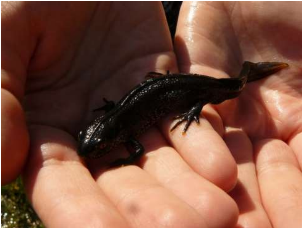
Abbildung 24: Kammolch-Männchen aus dem Untersuchungsgewässer 3 (eigene Aufnahme vom 04.06.2021).