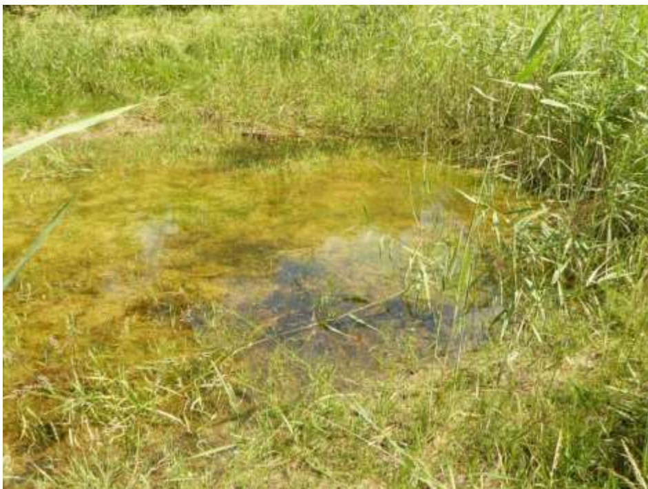
Abbildung 6: Amphibien - Gewässer A3 (eigene Aufnahme vom 21.06.2021).

Das Gewässer A3 liegt nördlich von Üfingen (Stadt Salzgitter) am Nordrand eines kleinen Waldgebietes auf einer Wiese (Abbildung 6). Im Norden verläuft eine Bahntrasse, während sich im Osten die Aue befindet. Die weitere Umgebung weist neben Grünlandflächen und Ruderalfluren entlang der Aue auch großflächige Äcker auf. Im Osten befinden sich mehrere Klärteiche und Abgrabungsgewässer sowie der Stichkanal Salzgitter. Der flache Kleinweiher weist eine gut ausgebildete Gewässervegetation auf und ist halb beschattet. Das klare Wasser weist keine Trübung auf. Der Gewässergrund ist mit dunklem, fauligem Schlamm bedeckt, stellenweise ist das Gewässer veralgelt. Die Gewässervegetation wird von Spreizendem Hahnenfuß ( Ranunculus circinatus ), Binsen ( Juncus sp. ) und flutenden Süßgräsern dominiert, der westliche Teil ist vollständig mit Schilf bestanden. Mitte Mai konnte ein männlicher Teichmolch mit Geschwür im Gewässer angetroffen werden. Bis zum Sommer sank der Wasserstand stark ab.