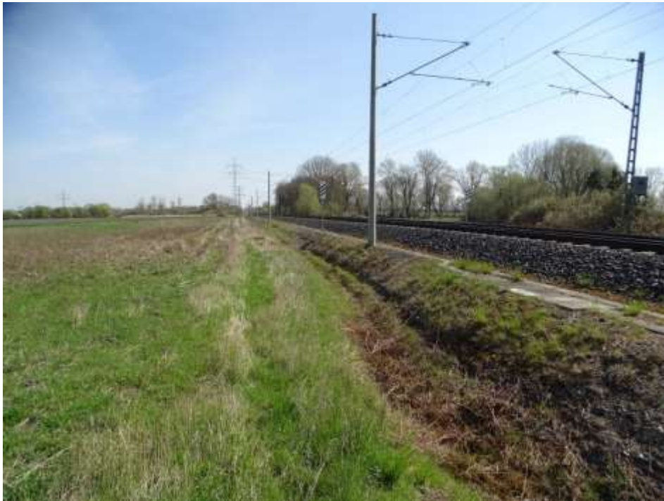
Abbildung 17: Reptilien – Fläche R4 (eigene Aufnahme vom 21.04.2021).