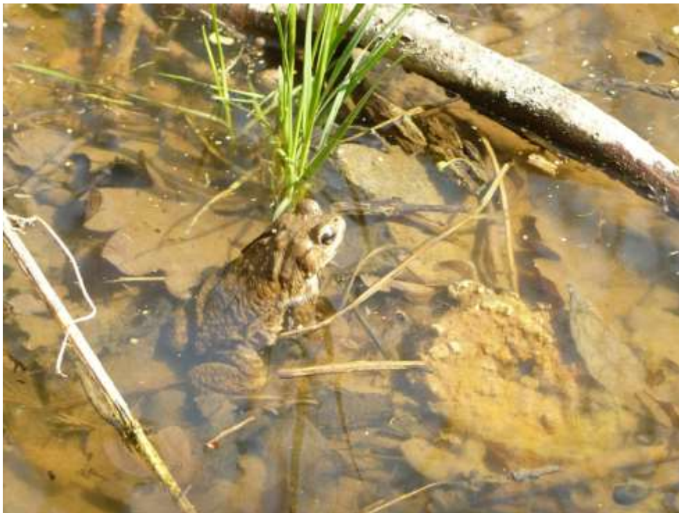
Abbildung 27: Erdkröte in Untersuchungsgewässer 9 (eigene Aufnahme vom 20.04.2021).