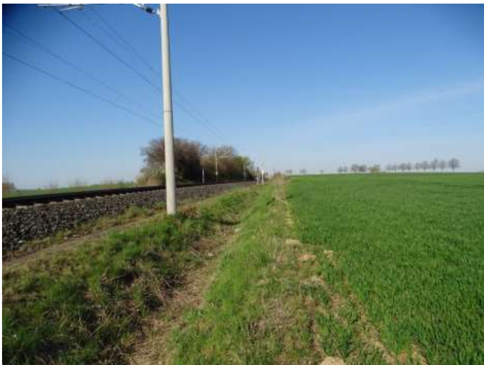
Abbildung 18: Reptilien – Fläche R1 (eigene Aufnahme vom 21.04.2021).