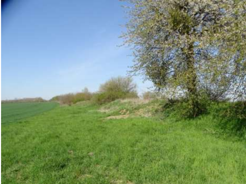
Abbildung 19: Reptilien – Fläche R3 (eigene Aufnahme vom 21.04.2021).