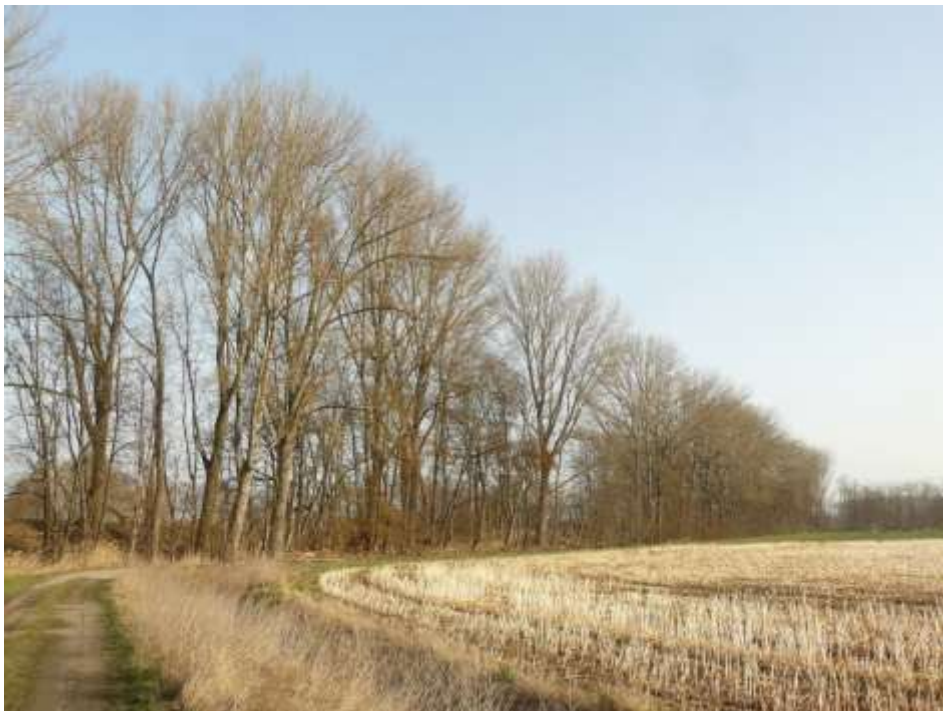
Abbildung 2: Baumreihe im Transekt F3 mit zahlreichen Habitatbäumen (eigene Aufnahme vom 25.02.2021).

sechs Fledermausarten nachgewiesen, darunter der Kleinabendsegler und die Rauhaufledermaus, die ebenfalls im Bereich der Abwasseraufbereitungsbecken und den angrenzenden Gehölzen jagten. Die Wasserfledermaus konnte ausschließlich in Transekt F3 eindeutig nachgewiesen werden, zudem liegt ein Einzelnachweis der ansonsten nur in Transekt F4 festgestellten Mückenfledermaus vor. Weitere Einzelnachweise wurden von den beiden Arten Fransenfledermaus und Großer Abendsegler erbracht. Die linearen Gehölzbestände innerhalb des Transektes weisen einen hohen Altbaumanteil mit zahlreichen Habitatbäumen auf, welche baumhöhlenbewohnenden Fledermausarten als Quartiere dienen können. Die folgende Abbildung 2 zeigt einen Teil des Transektes F3.