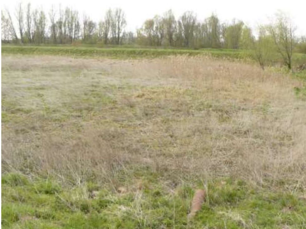
Abbildung 22: Bereits während der Übersichtsbegehung komplett ausgetrockneter Gewässer-komplex südlich von Wierthe (eigene Aufnahme vom 23.04.2021).