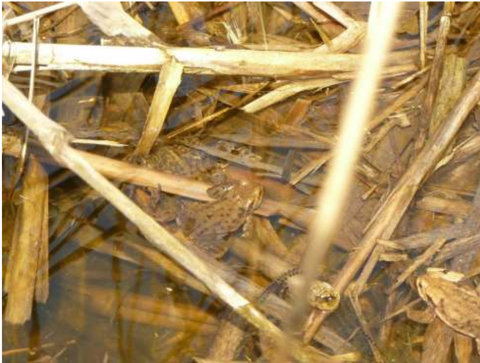
Abbildung 26: Erdkröten und Laichschnüre in Gewässer 7 (eigene Aufnahme vom 20.04.2021).