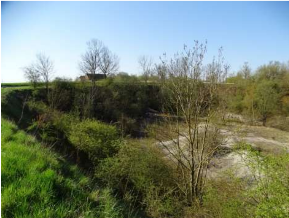
Abbildung 16: Reptilien – Fläche R2 (eigene Aufnahme vom 21.04.2021).