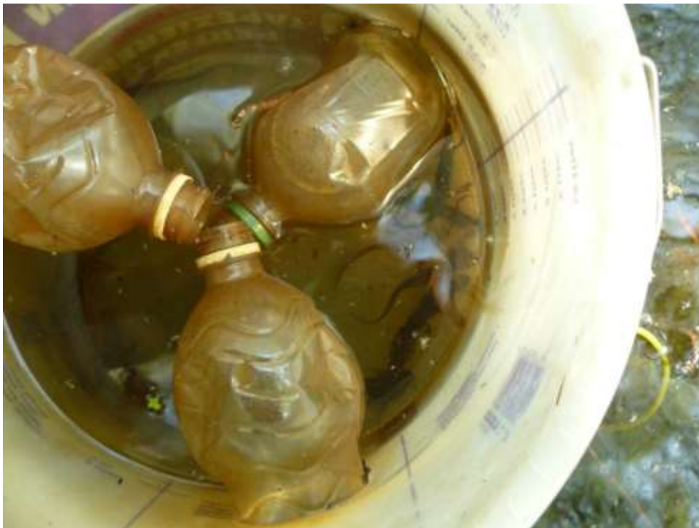
Abbildung 25: Zahlreiche Teichmolche in einer Eimerfalle am Gewässer 4 (eigene Aufnahme vom 04.06.2021).