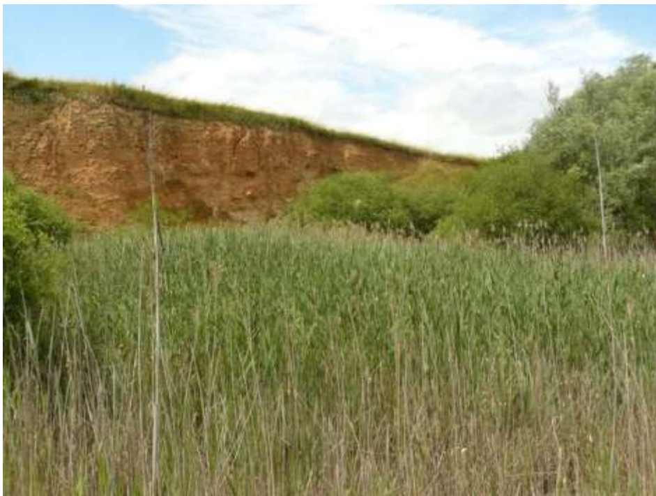
Abbildung 8: Amphibien - Gewässer A7 (eigene Aufnahme vom 21.06.2021).

Das Gewässer A7 liegt südlich der Ortschaft Woltwiesche (Gemeinde Lengede) innerhalb eines stillgelegten Kalkbruchs (Abbildung 8). Der Kalkbruch ist mit halbruderaler Gras- und Staudenflur und Gehölzen bestanden, randlich sind Steilwände vorhanden. Außerhalb des Kalkbruchs erstrecken sich großflächige, strukturarme Ackerflächen. Das Untersuchungsgewässer befindet sich im Südwesten des Kalkbruchs. Der flache Kleinweiher ist stark verlandet und weist eine leicht bräunliche Gewässertrübung auf. Das Gewässer wird von den umliegenden Gehölzen nur gering beschattet, der Gewässergrund ist sehr schlammig mit fauligem Geruch. Zudem war das Gewässer zum Zeitpunkt der Kartierung leicht veralgt sowie stellenweise vermüllt. Der Kleinweiher ist vollständig mit Schilf und Breitblättrigem Rohrkolben ( Typha latifolia ) bestanden. Stellenweise wachsen Moos und Schmalblättriger Rohrkolben ( Typha angustifolia ) im Gewässer. Die Ufer sind mit Silber-Weide, Sal-Weide ( Salix caprea ) und Grau-Weide ( Salix cinerea ) bestanden. Bis zum Sommer sank der Wasserstank stark ab.