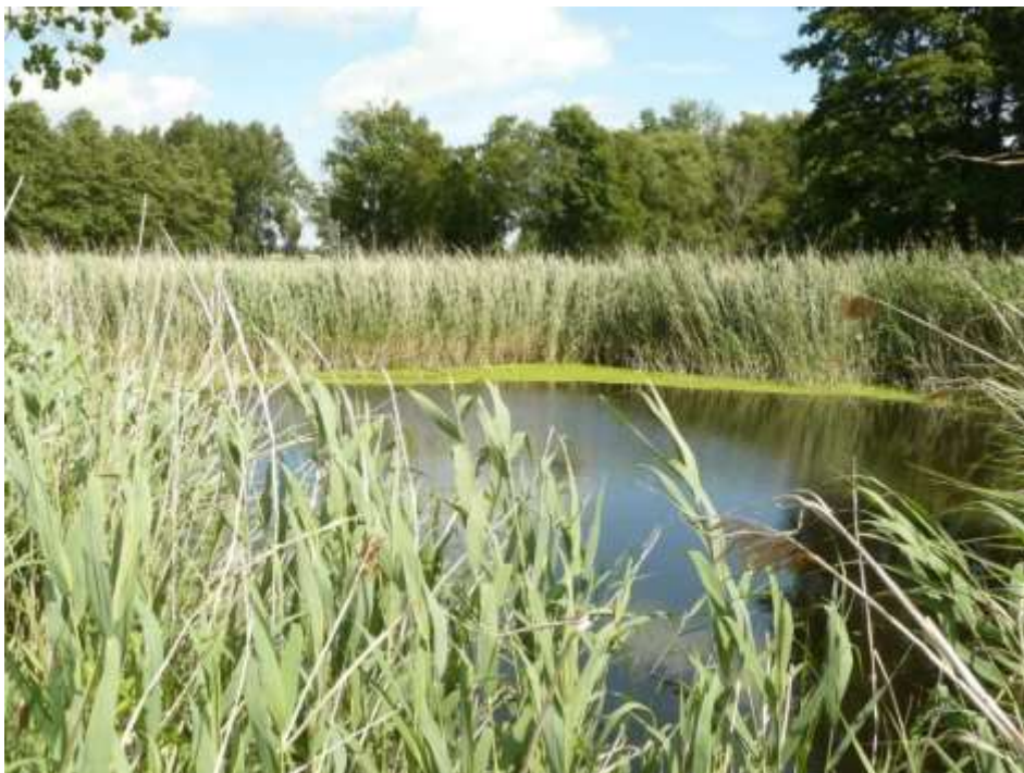
Abbildung 5: Amphibien - Gewässer A2 (eigene Aufnahme vom 21.06.2021).

Der Kleinweiher liegt in der Gemeinde Vechelde zwischen Vallstedt und Alvesse in der Niederung des östlich verlaufenden Dumbruchgrabens (Abbildung 5). Die Gewässerumgebung setzt sich aus Grünland und kleineren Erlenwäldern zusammen, im weiteren Umfeld ist die Gegend jedoch großräumig von Ackerflächen geprägt. Die Ufer fallen steil ab, sodass das Gewässer schnell tief wird und kaum Flachwasserbereiche vorhanden sind. Der sonnenexponierte Kleinweiher weist eine bräunliche Trübung auf. Das Gewässer ist vollständig mit Schilf ( Phragmites australis ) bestanden, sodass ein Bekeschern kaum möglich war. Außerdem wachsen Kanadische Pappel ( Populus x canadensis ), Kletten-Labkraut ( Galium aparine ), Gewöhnliche Zaunwinde ( Calystegia sepium ) und Große Brennnessel ( Urtica dioica ) an den Ufern, vereinzelt ist auch Kleinblütiges Weidenröschen ( Epilobium parviflorum ) vorhanden. Die Gewässeroberfläche ist stellenweise mit Vielwurziger Teichlinse ( Spirodela polyrhiza ) bedeckt. Bis zum Sommer veralgte das Gewässer leicht. Im Gewässer sind viele Schnecken und Röhrenwürmer vorhanden.