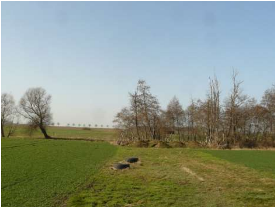
Abbildung 3: Schwarzerlenbestand am Dumbruchgraben im Transekt F2 (eigene Aufnahme vom 25.02.2021).