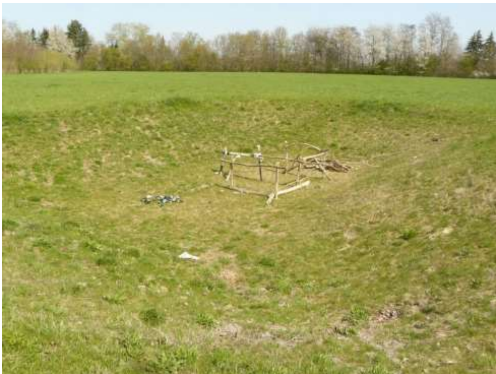
Abbildung 23: Vollständig ausgetrocknetes Kleingewässer in der Niederung der Aue südlich der Klärteiche der Salzgitter AG (eigene Aufnahme vom 20.04.2021).