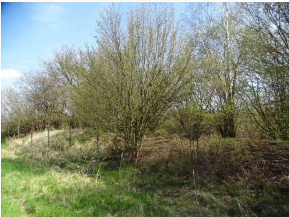
Abbildung 21: Reptilien – Fläche R7 (eigene Aufnahme vom 21.04.2021).