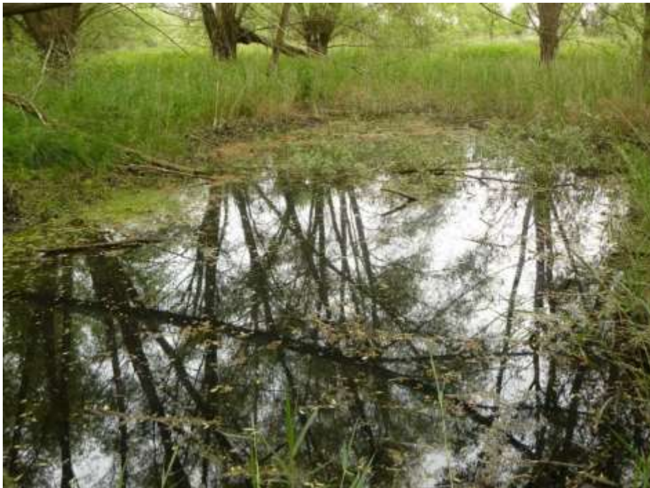
Abbildung 7: Amphibien - Gewässer A4 (eigene Aufnahme vom 04.06.2021).

Das Gewässer A4 befindet sich südlich von Gewässer A3 innerhalb des kleinen Waldbestandes (Abbildung 7). Der Kleinweiher ist überwiegend flach und weist eine leicht bräunliche Trübung auf. Durch die umliegenden Gehölze wird das Gewässer vollständig beschattet und es findet ein hoher Laub- und Totholzeintrag statt. Das Gewässer weist einen fauligen Geruch auf. Im Kleinweiher sind sehr viele Wasserkäfer und Insektenlarven vorhanden. Die Gewässervegetation ist nur stellenweise ausgebildet und setzt sich aus Schilf und Kleiner Wasserlinse ( Lemna minor ) zusammen. An den Ufern wachsen u. a. Silber-Weide ( Salix alba ) und Große Brennnessel. Bis zum Sommer sank der Wasserstand deutlich ab.