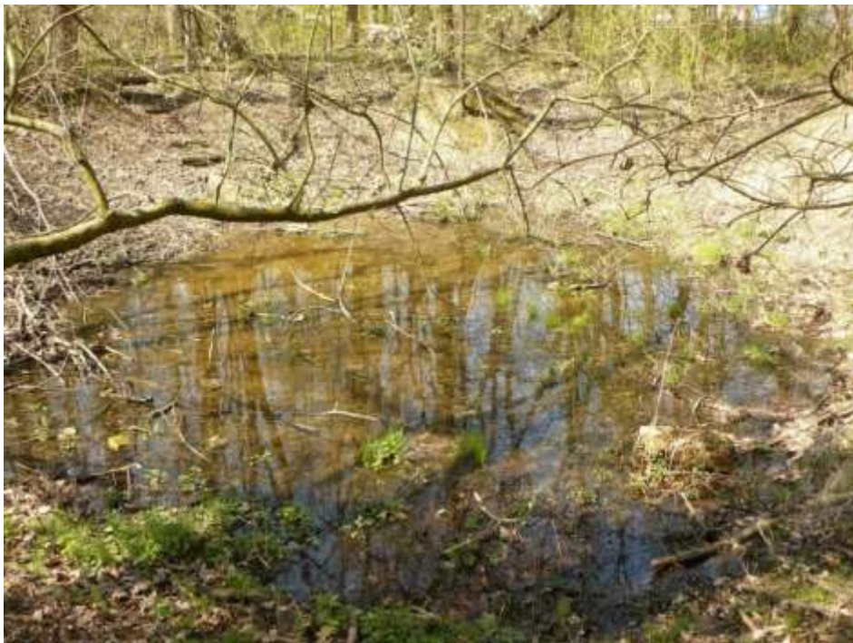
Abbildung 10: Amphibien - Gewässer A9 (eigene Aufnahme vom 20.04.2021).

Das Gewässer A9 befindet sich nördlich von Hallendorf (Stadt Salzgitter) im Hallendorfer Holz. Im Westen verläuft die BAB 39. Neben größeren Mischwaldbeständen sind in der näheren Gewässerumgebung auch Wiesen, Ruderalfluren und Ackerflächen vorhanden. Im Norden liegt das UW Salzgitter-Hallendorf, im Osten befindet sich der Stichkanal Salzgitter. Bei Gewässer 09 handelt es sich um einen überwiegend beschatteten Bombentrichter mit leicht bräunlicher Gewässertrübung. Durch die umliegenden Gehölze findet ein hoher Laub- und Totholzeintrag statt (Abbildung 10). Das flache, stark verlandete Gewässer war zum Zeitpunkt der Kartierungen leicht veralgt. Die Gewässervegetation ist gut ausgebildet und setzt sich aus Gift-Hahnenfuß ( Ranunculus sceleratus ), Süßgräsern sowie vereinzelt Sumpf-Wasserstern zusammen. An den Ufern wachsen Ahorn ( Acer sp. ), Gewöhnliche Esche ( Fraxinus excelsior ), Stiel-Eiche ( Quercus robur ), Trauer-Weide ( Salix x chrysocoma ), Ruprechts-Storchschnabel ( Geranium robertianum ) und Große Brennnessel. Es sind sehr viele Insektenlarven im Gewässer vorhanden.