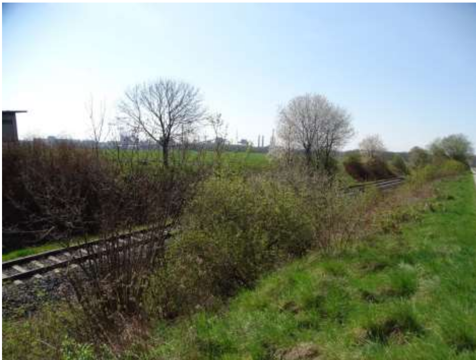
Abbildung 15: Reptilien – Fläche R5 (eigene Aufnahme vom 21.04.2021).