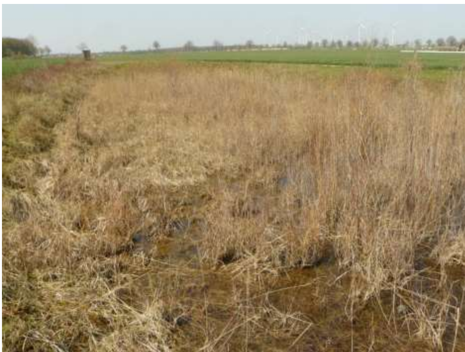
Abbildung 13: Amphibien - Gewässer A1 (eigene Aufnahme vom 20.04.2021).

Das Gewässer A1 liegt nördlich der Ortschaft Klein Lafferde in der Gemeinde Vechelde. Die Gewässerumgebung wird von strukturarmen Ackerflächen dominiert, vereinzelt sind Feldgehölze sowie kleinere Waldgebiete vorhanden. Im Norden verläuft die B 1. Der sonnenexponierte, vegetationsreiche Kleinweiher weist klares Wasser auf. Innerhalb des Gewässers sind zahlreiche Insektenlarven vorhanden. Es findet etwas Mülleintrag statt, zudem befanden sich zum Zeitpunkt der Kartierungen in der Nähe des Hochsitzes am Westufer Zuckerrüben im Wasser. Der Kleinweiher ist vollständig mit Schilf und aufkommenden Weiden bestanden. Die flach abfallenden Ufer sind neben einigen sandigen Offenbodenbereichen überwiegend mit halbruderaler Gras- und Staudenflur bewachsen (Abbildung 13). Bis Anfang Juni trocknete das flache Gewässer vollständig aus.