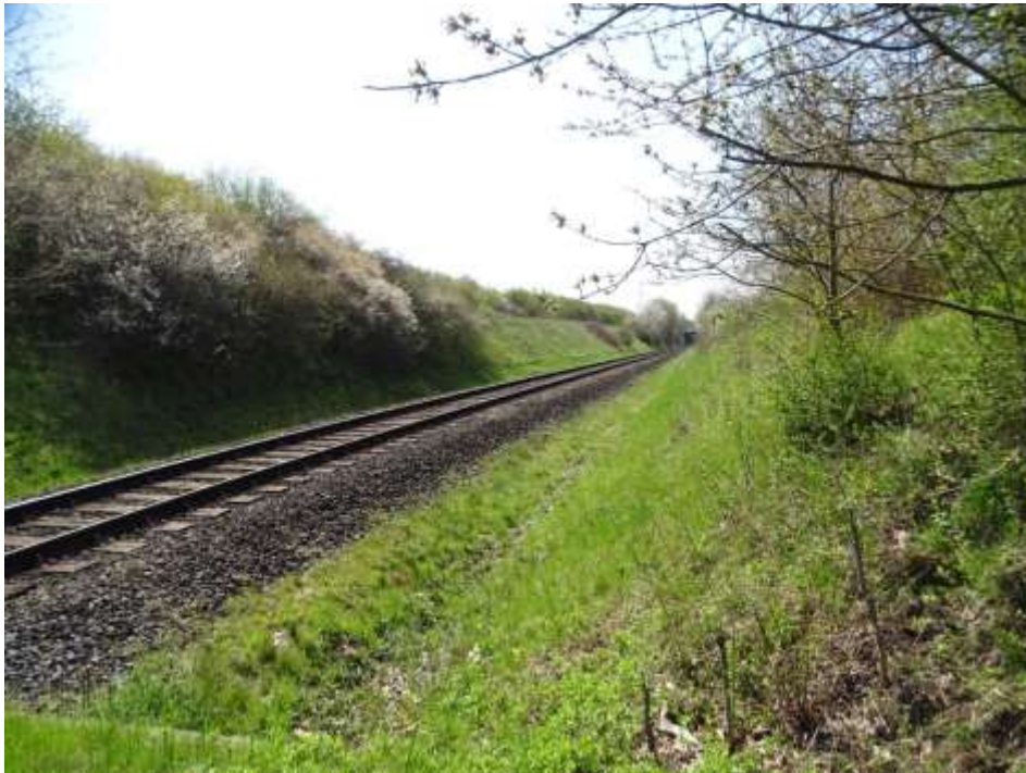
Abbildung 20: Reptilien – Fläche R6 (eigene Aufnahme vom 21.04.2021).