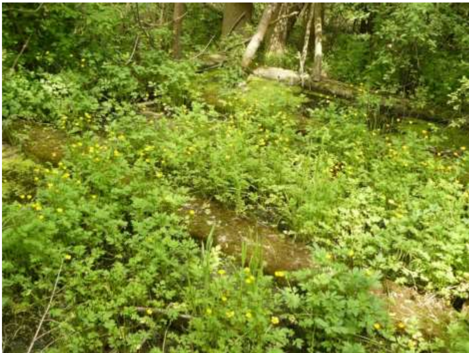
Abbildung 11: Amphibien - Gewässer A10 (eigene Aufnahme vom 04.06.2021).

Das Untersuchungsgewässer A10 befindet sich südlich von Gewässer 09 ebenfalls im Hallendorfer Holz. Es handelt sich um mehrere mit Betonwänden eingefasste, nicht mehr genutzte und daher stark verlandete Anzuchtbecken (Abbildung 11). Die sehr flachen Becken weisen eine leicht bräunliche Gewässertrübung auf und waren zum Zeitpunkt der Kartierungen teilweise veralgt. Durch die umliegenden Gehölze werden die Becken halb beschattet und es findet ein hoher Laub- und Totholzeintrag statt. Die Becken sind überwiegend mit Gift-Hahnenfuß bestanden, stellenweise ist auch Kleine Wasserlinse vorhanden. Am Beckenrand wachsen Gewöhnliche Esche, Schlehe ( Prunus spinosa ), Blutroter Hartriegel ( Cornus sanguinea ), Zottiges Weidenröschen ( Epilobium hirsutum ) und Große Brennnessel.