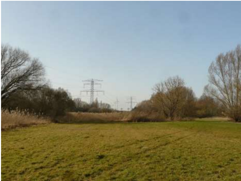
Abbildung 4: Ostufer der Fuhse im Transekt F4 (eigene Aufnahme vom 25.02.2021).