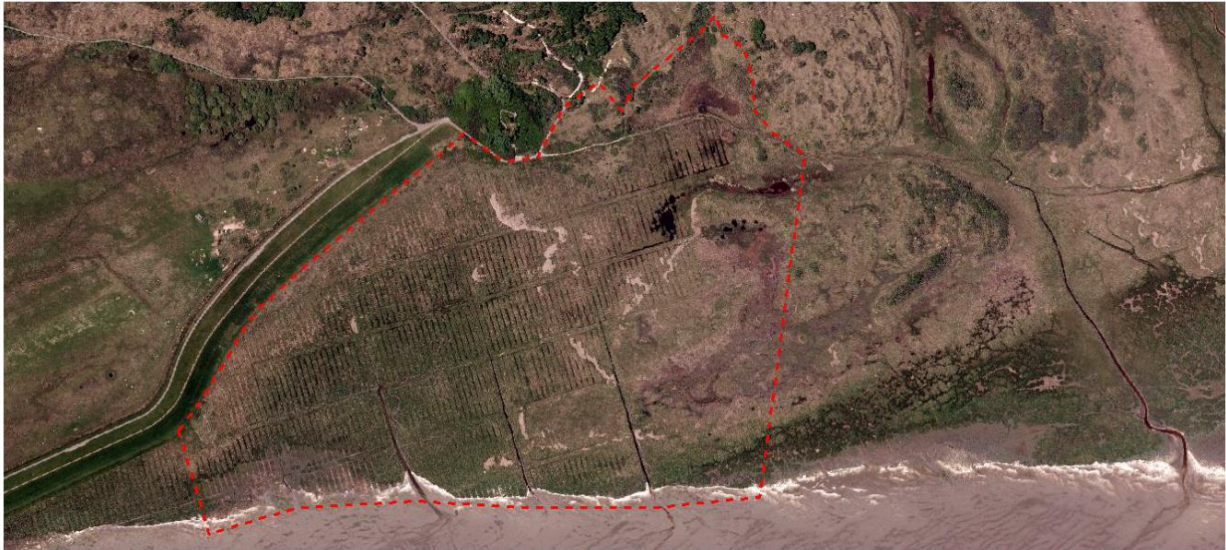
Abbildung 4-1: Maßnahmenfläche

Erläuterungen: aufgenommen im Jahr 2013, Forschungsstelle Küste