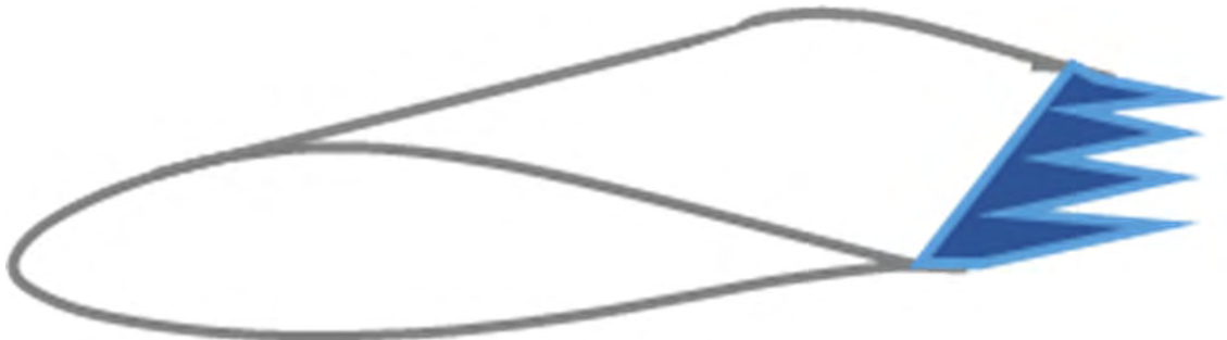
Abb. 2 Prinzipskizze Serrations

Serrations ersetzen den gradlinigen Verlauf der Hinterkante des Rotorblatts durch eine gezackte Linie (siehe Abb.2). Dieser Verlauf führt dazu, dass der Übergang auf die freie Außenströmung der in der Grenzschicht vorhandenen Wirbel an der Hinterkante nicht mehr schlagartig sondern graduell, entlang der von den Serration-Zacken geformten neuen schrägen Hinterkante, erfolgt. Somit wird das Entstehungsprinzip des turbulenten Hinterkantenschalls beeinflusst und eine Lärminderung erzielt.