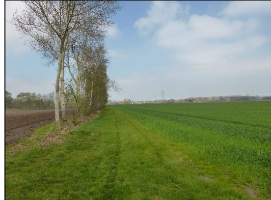
Abb. 4 Blick auf den geplanten Standort der WEA 3; Ost.