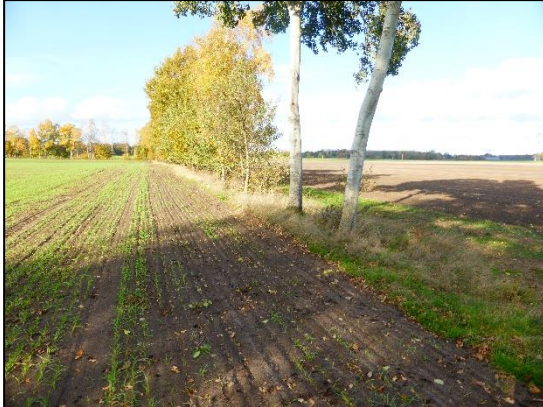
Abb. 3 Blick auf den geplanten Standort der WEA 3; West.

Wallhecken, Einzelbäumen und Feldgehölzen vorhanden. Zudem wird der geplante WP von einer Vielzahl von Entwässerungsgräben durchzogen. Der vorgesehene Anlagenstandort Nr. 3 des Antrags Nr. 2 befindet sich auf einer Ackerfläche.