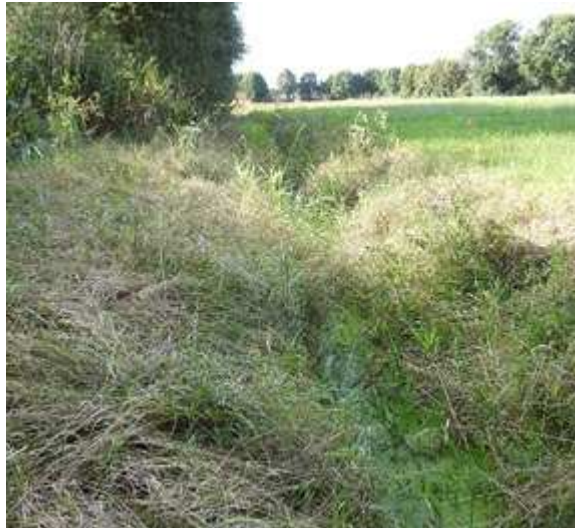
Abbildung 1: Untersuchter Graben bei Schinna.