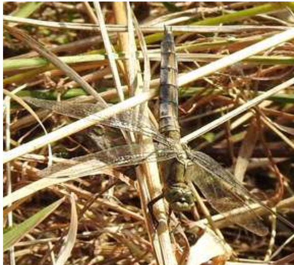
Abbildung 4: Altes Weibchen von Orthetrum cancellatum an dem untersuchten Graben.