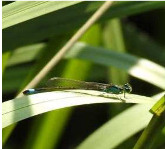
Abbildung 3: Ischnura elegans an dem untersuchten Graben.