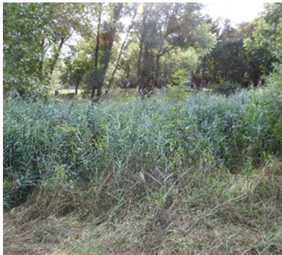
Abbildung 2: Untersuchtes Kleingewässer westlich des Grabens.