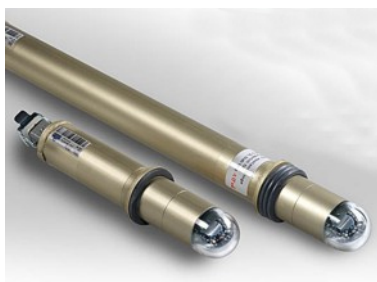
Abb. 2: Befeuerungsleuchte Turm

Durch behördliche Vorschriften kann eine Befeuerung des Turms gefordert werden. Dazu wird der Turm mit einer, seltener mit zwei Befeuerungsebenen mit jeweils 4 Stableuchten ausgerüstet. Eine Nachrüstung von Leuchten am Turm ist nur mit sehr hohem Aufwand möglich.