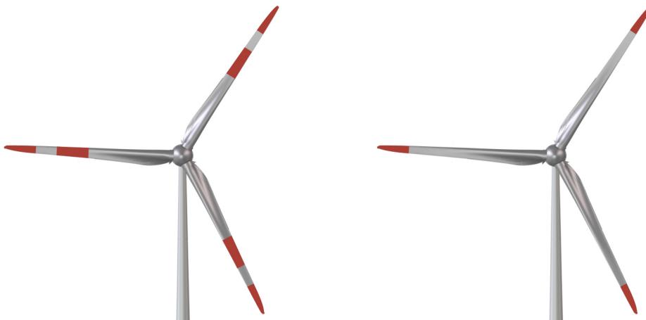
Abb. 3: Farbliche Kennzeichnung am Rotorblatt

Zur farblichen Kennzeichnung werden 6 m breite Streifen im Farbton Verkehrsrot (RAL 3020) an den Rotorblättern angebracht.