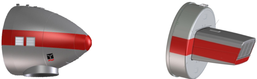
Abb. 4: Farbliche Kennzeichnung an der Gondel, Tropfenform (links) und Kompaktform (rechts)

Zur farblichen Kennzeichnung wird ein 2 m hoher, umlaufender Farbstreifen in Verkehrsrot (RAL 3020) an der Gondel angebracht.