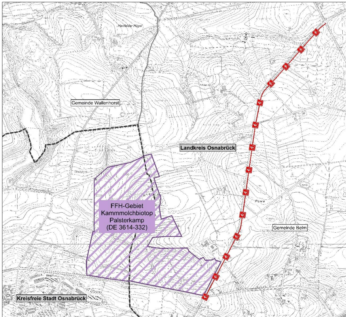
Abb. 1 Lageplan (unmaßstäblich)