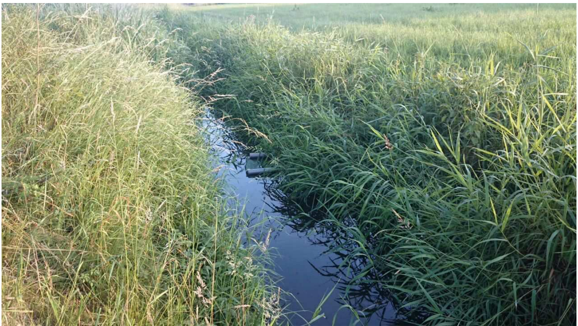
Abb. 3 Im Bruchgraben exponierte Molchfallen