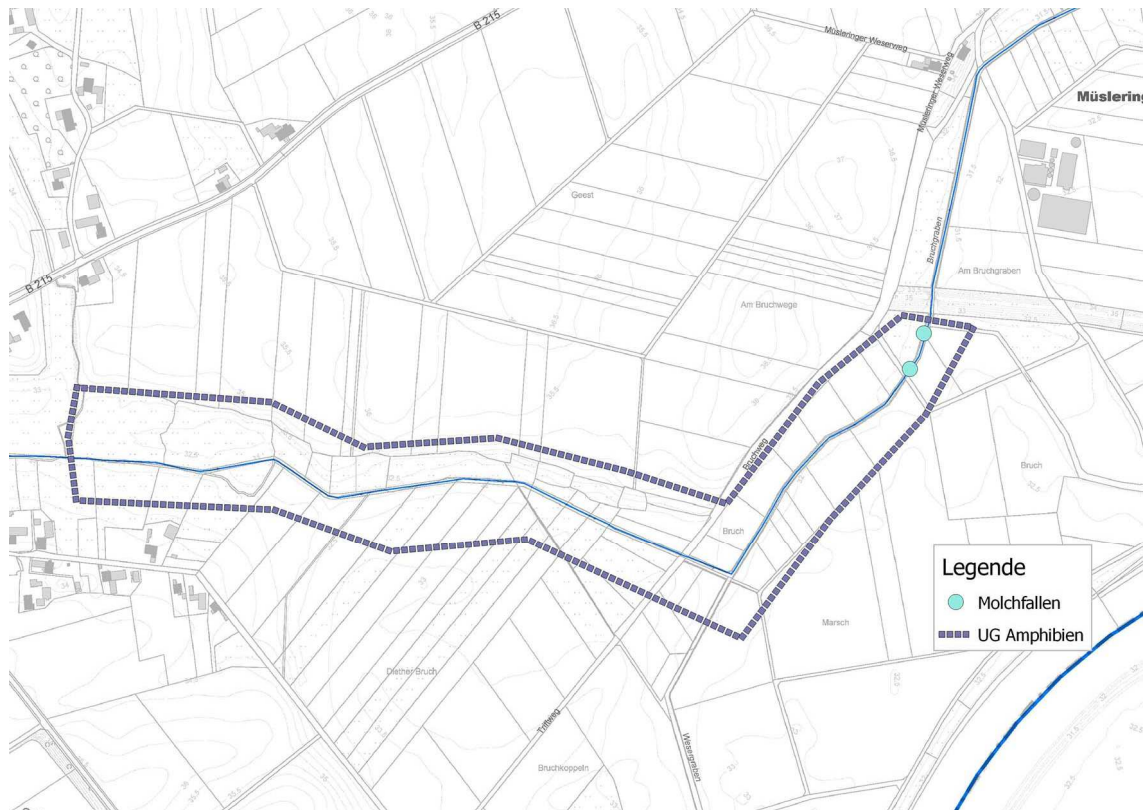
Abb. 4 Lage der Molchfallen-Standorte am östlichen Ende des UG Amphibien