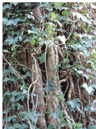
Abbildung 8: Altes Efeu an einer Eiche