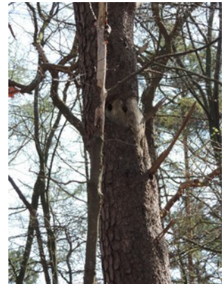
Abbildung 5: Mehrere Spechtlöcher, Baum 260a