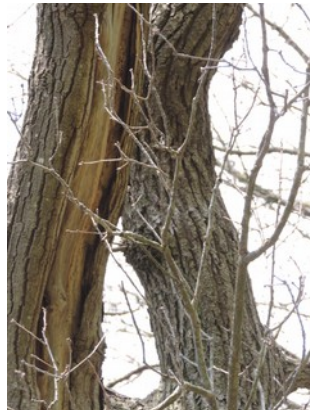
Abbildung 3: Abstehende Rinde, Baum Nr. 177