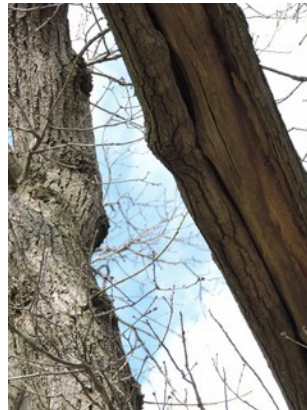
Abbildung 4: Tiefe Spalten, Baum Nr. 177