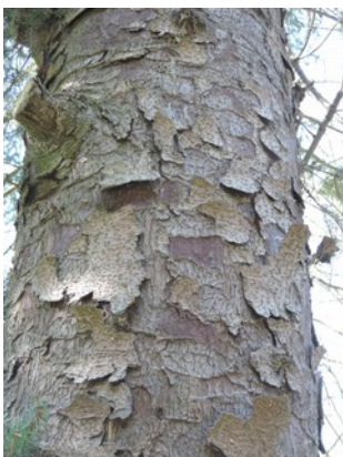
Abbildung 6: Abstehende Rinde an einer Fichte