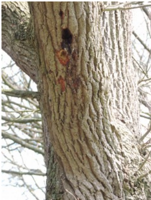
Abbildung 2: Spechthöhle in Baum Nr. 177