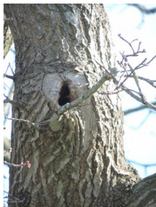
Abbildung 7: Astungswunde an einer Eiche