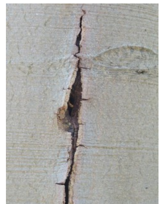
Abbildung 9: Risse und Spalten in einer Buche